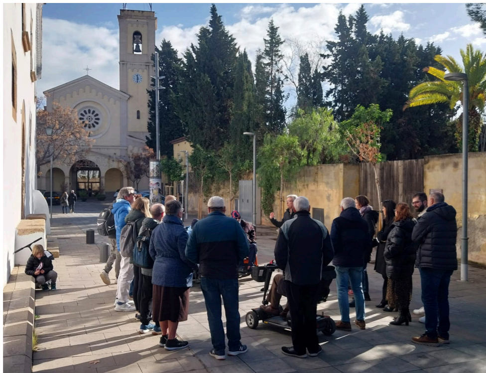
Fig. 5 Marxa exploratòria

Les actes dels diferents tallers, així com les aportacions i propostes rebudes i la seva valoració tècnica, es troben publicades al portal Esplugues Participa.