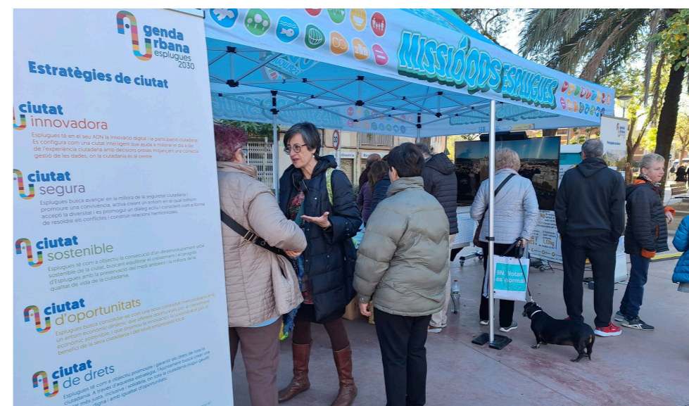
Fig. 4 Festa de la inclusió i el voluntariat

S'ha habilitat un apartat específic al portal Esplugues Participa amb informació del procés i espais per recollir aportacions als 32 Objectius Estratègics i propostes de noves idees. Ha pogut participar qualsevol persona, major de 16 anys, empadronada a la ciutat d'Esplugues. Han participat un total de 25 persones fent aportacions i/o comentaris a títol individual.