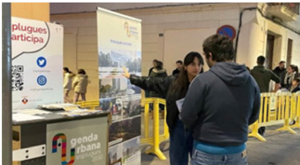
Fig. 2 Punt mòbil de participació

Més de 2.500 persones han estat informades del procés a través dels canals següents: