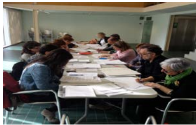
Sessió transversal de diagnosi amb tècnics municipals

Els 4 productes de la diagnosi, com ja s'ha dit, es van elaborar a partir d'una mateixa estructura d'àmbits d'anàlisi (mantinguda durant la fase de propostes a partir d'elaboració d'una línia estratègica per cada àmbit):