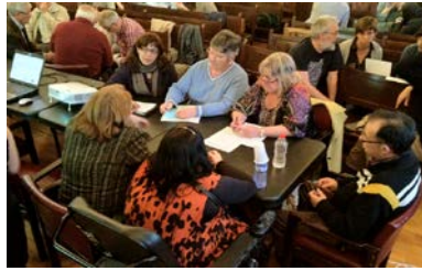
Taller participatiu de diagnosi amb el Consell per la Cohesió Social