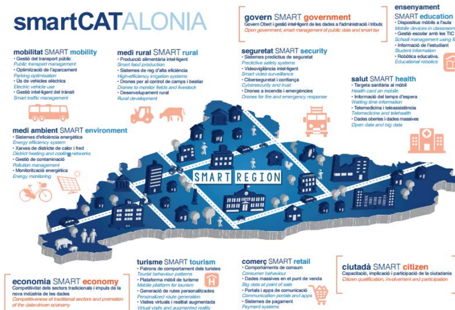
Figura 1: Infografia estratègia SmartCAT

El desenvolupament d'aquesta estratègia va a càrrec del Departament d'Empresa i Ocupació, a través de la Direcció General de Telecomunicacions i Societat de la Informació, unitat que coordinarà l'estratègia de l'Smart Region de Catalunya. El Govern treballarà per fomentar el sector relacionat amb l'economia i la indústria de les dades en col·laboració amb tots els departaments i entitats de l'Administració de la Generalitat de Catalunya, en especial el Departament de la Presidència, a través de la Direcció General d'Atenció Ciutadana i Difusió, com a unitat impulsora de les polítiques de govern obert a l'Administració de la Generalitat; i el Departament de Governació i Relacions Institucionals, com a impulsor del procés de reforma i modernització de l'Administració de la Generalitat.