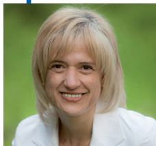
Pilar Díaz, alcaldesa

El mes de mayo es el mes de las personas mayores en Esplugues. Un periodo lleno de actividades en torno a este importante colectivo de nuestra ciudad. Personas que han aportado mucho a nuestra sociedad y en esta etapa hay que garantizar su calidad de vida.